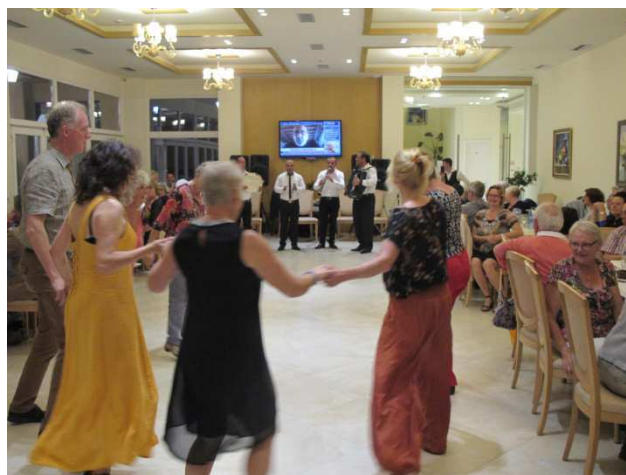
Une soirée très animée par une chorale hollandaise et musiciens locaux