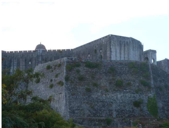
La nouvelle citadelle vénitienne