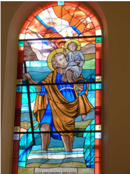
Vitrail de St Christophe