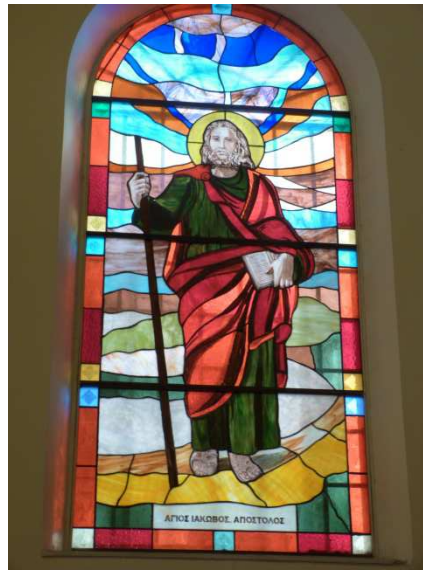
Vitrail de St Jacques