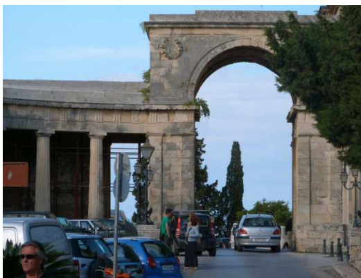
La porte St Georges