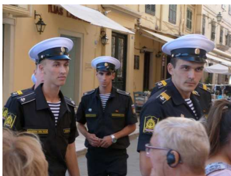
Rencontre avec des marins russes

Nous quittons Corfou en réembarquant. Arrivée tardive à Saranda .Dîner servi à l'hôtel