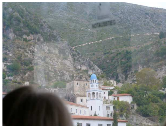
Une église dans un village perché dans la montagne