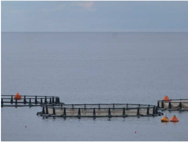
L'élevage en mer de la daurade