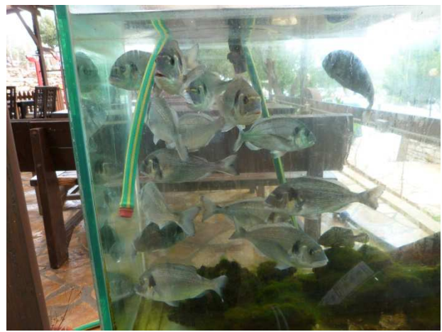
La daurade en aquarium

A Himara , nous nous arrêtons devant le vieux château d'Ali Pasha est situé dans l'un des endroits les plus splendides de la baie.