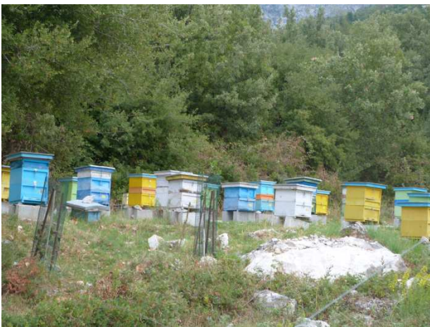
Un arrêt miel