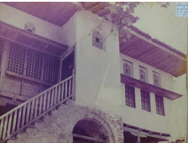
La façade du musée ethnographique

Fuyant la pluie nous nous réfugions dans le musée ethnographique, aménagé dans une superbe maison traditionnelle. Magnifiques plafonds, peintures murales somptueuses, coffres d'époque, meubles anciens, costumes régionaux et authentiques objets de la vie courante y sont rassemblés en une mise en scène très réussie.