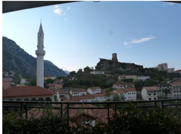
L'hôtel Panorama au centre