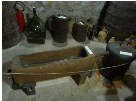
Un alambic artisanal